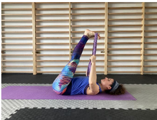
25 Rozciąganie nóg z paskiem (obie nogi)