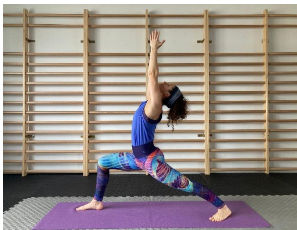
20 Wojownik I