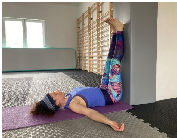
26 Viparita karani