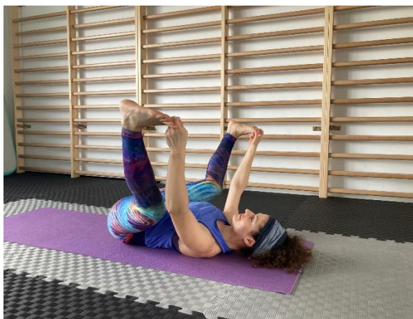
23 Happy baby pose